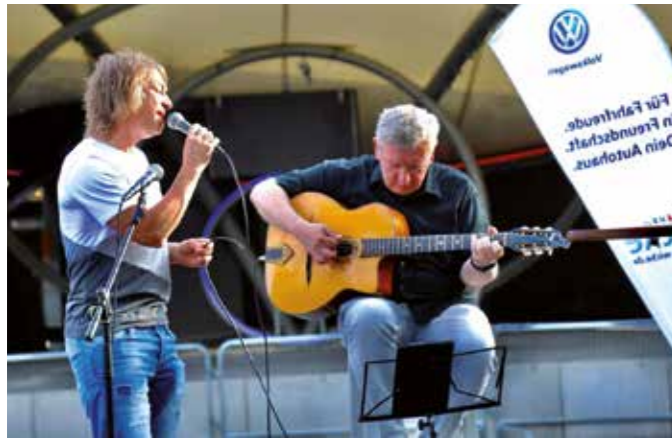
Bermuda Talk (15.08.2021, Mandragora Biergarten im Bermuda3Eck)