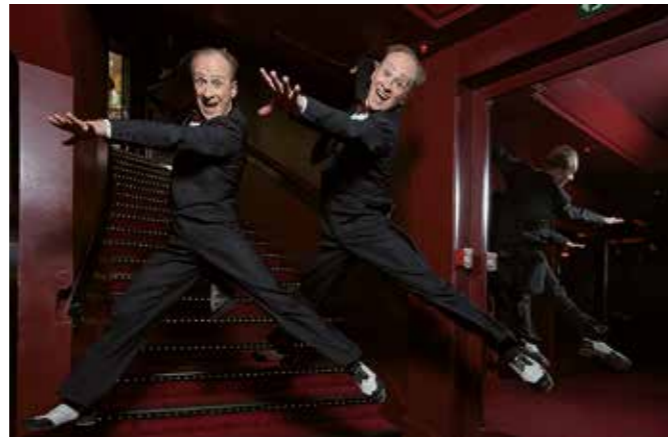
Variété et cetera – Hurra, wir sind wieder da (Bochum, 08.08.2021, 19 Uhr)