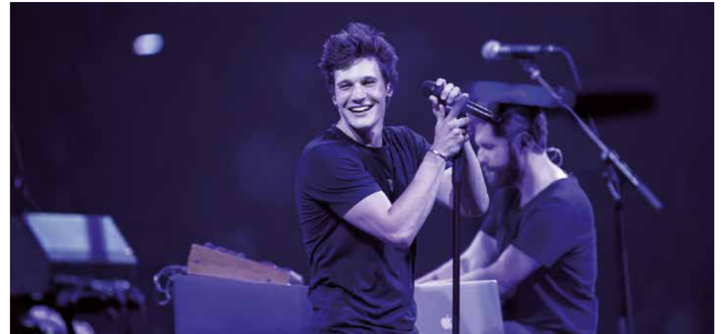
Wincent Weiss – Strandkorb Open Air (Bochum 20.08.2021)